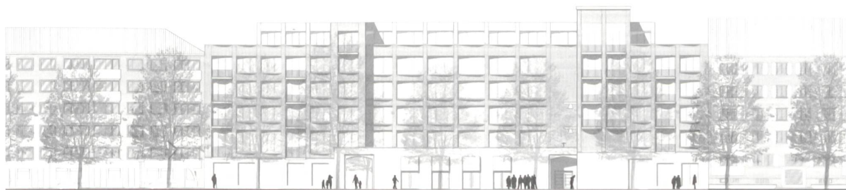
Das Siegerprojekt «Camminato» fügt sich nahtlos in die Umgebung ein, Ansicht Ostfassade Mst. 1:600.