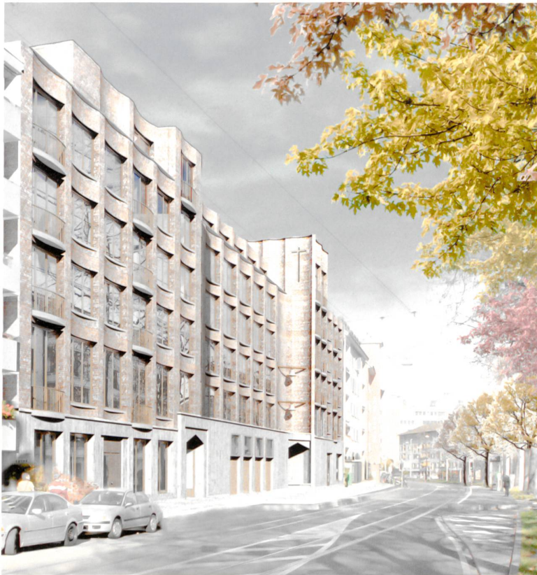
Die horizontale und vertikale Gliederung der Fassade im Siegerprojekt vermittelt geschickt zwischen öffentlichem Ausdruck und einer Einordnung in den Kontext.

D as Pfarrzentrum St. Christophorus liegt unmittelbar an der viel befahrenen Strasse für Pendler und Einkaufstouristen, die den nördlichsten Teil von Kleinasel mit Weil am Rhein verbindet. Es besteht aus einer kleinen Kirche, einem Pfarrhaus, einem Sigristenhaus und einem Pfarreiheim mit Saal und Vereinsräumen. Die römisch-katholische Kirche des Kantons Basel-Stadt scheut die anstehende Sanierung angesichts kaum vertretbarer Kosten.