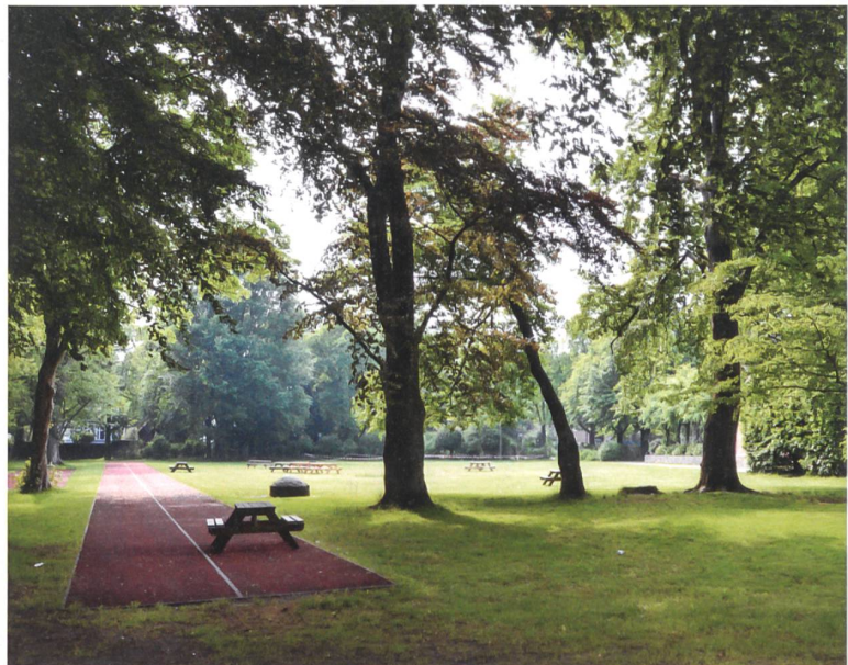
Der ehemalige Garten Emden in Hamburg heute, entworfen von Leberecht Migge.