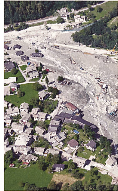
Zerstörte Landschaft: das Dorf Bondo , teilweise von Schutt begraben.

Die Physik der Ereignisse zu modellieren ist sehr schwierig. Kleinste Änderungen im Ausgangszustand oder im Ablauf können die Morphologie eines Bergsturzes komplett verändern. In gewissen Fällen breiten sich diese zum Schuttkegel aus; in anderen Fällen schlängelt sich ein Rutsch mitten durch dichte Steinvülste. Eine derart kanalisierte Schuttbahn kann sich in die Länge ziehen, weniger Energie verlieren und manchmal überraschende Wege einschlagen. Obwohl oft der gegenteilige Eindruck entsteht, lässt sich vieles noch nicht rechnerisch simulieren. Beobachtungen im Gelände und die Analyse der Ereignisse bleiben daher zwingend und müssen in die Modelle einfließen. In der Strömungsmechanik muss man sich zudem auf Überraschungen gefasst machen.