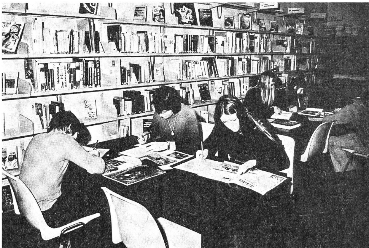
Vorbereitung von Schülerreferaten im Informationszentrum des Oberstufenschulhauses Bonstetten

Wie aber die Bibliotheksstatistik 1975 zeigt, sind die Vorbilder gesamthaft gesehen spärlich. Nur etwa 10—15 % aller Schulen haben bis heute eine Freihandbibliothek mit einem eigenen Bibliotheksraum, einem modernen Ausleihsystem und einer Katalogisierung nach der «Arbeitstechnik für Schul- und Gemeindebibliotheken» des Schweizer Bibliotheksdienstes Bern. Zu oft trifft man noch die zerschlissenen Klassenzimmerserien auf dem obersten Regal des Wandschranks an. Dieser Art von Bibliothek gelingt es kaum, den Schüler zum Lesen zu verlocken, da sie nur wenig Erneuerung erfährt, und die Sachbücher auch heute noch fast ganz fehlen. Wenn in einem Magazinraum Kästen voll Bücher stehen, zwar in Folie eingebunden, aber mit einer laufenden Nummer signiert, ist das noch lange keine Freihandbibliothek.