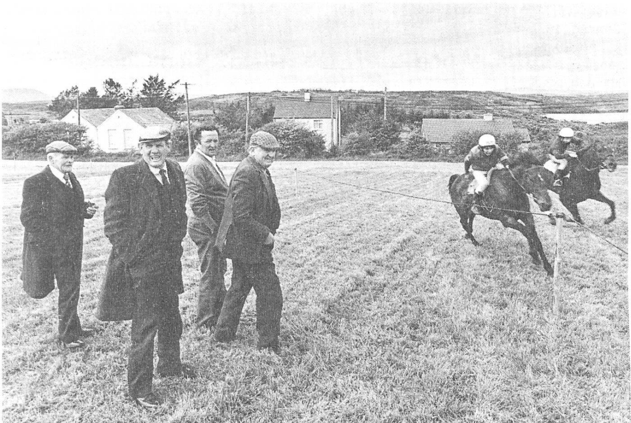
Pferdesport erfreut sich in Irland grosser Beliebtheit. Schon früh übt sich, wer ein (Meister)jockey werden will.