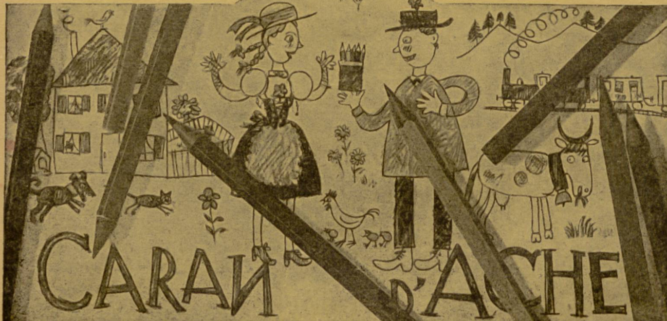
Die Schweizer Qualitäts-Farbstifte