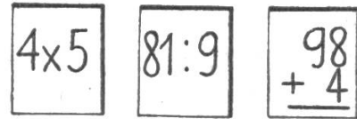
Rückseite der Kärtchen