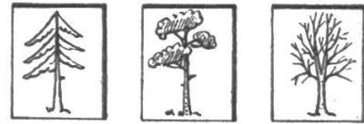
Vorderseite der Kärtchen