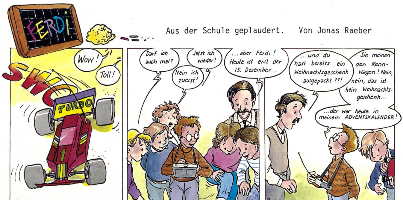
Aus der Schule geplaudert. Von Jonas Raeber

Seilerey Denzler AG, Torgasse 8, 8024 Zürich, 01/252 58 34 Zürcher & Co., Handwebgarne, Postfach, 3422 Kirchberg, 034/45 51 61 SACO SA, 2006 Neuchâtel, 038/25 32 08, Katalog gratis, 3500 Artikel