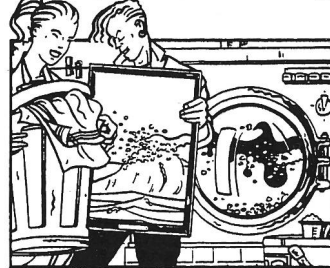
Gastgeberische Fähigkeiten und Organisationstalent in der Führung eines Hotel-Haushaltes.

Ich möchte mehr Infos über folgenden Beruf: