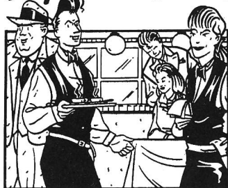
Stil und Freude an Esskultur im Service.