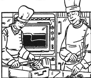
Kreativität und Können in der Küche.