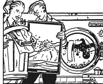
Gastgeberische Fähigkeiten und Organisationstalent in der Führung eines Hotel-Haushaltes.

Ich möchte mehr Infos über folgenden Beruf: