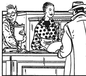
Weltgewandtheit am Empfang.