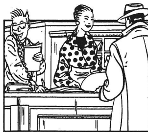
Weltgewandtheit am Empfang.