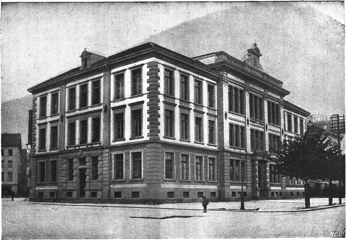
Schulhaus in Chur.