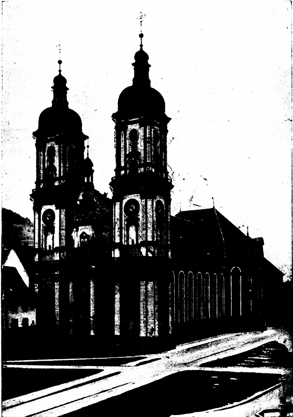
Klosterkirche in St. Gallen.

Abt Gozbert ließ 822—832, der Bedeutung des Ortes entsprechend, eine prachtvolle, dreischiffige Basilika erbauen. Sein Plan für die großartige Klosteranlage wird in der Stiftsbibliothek aufbewahrt. Besondere