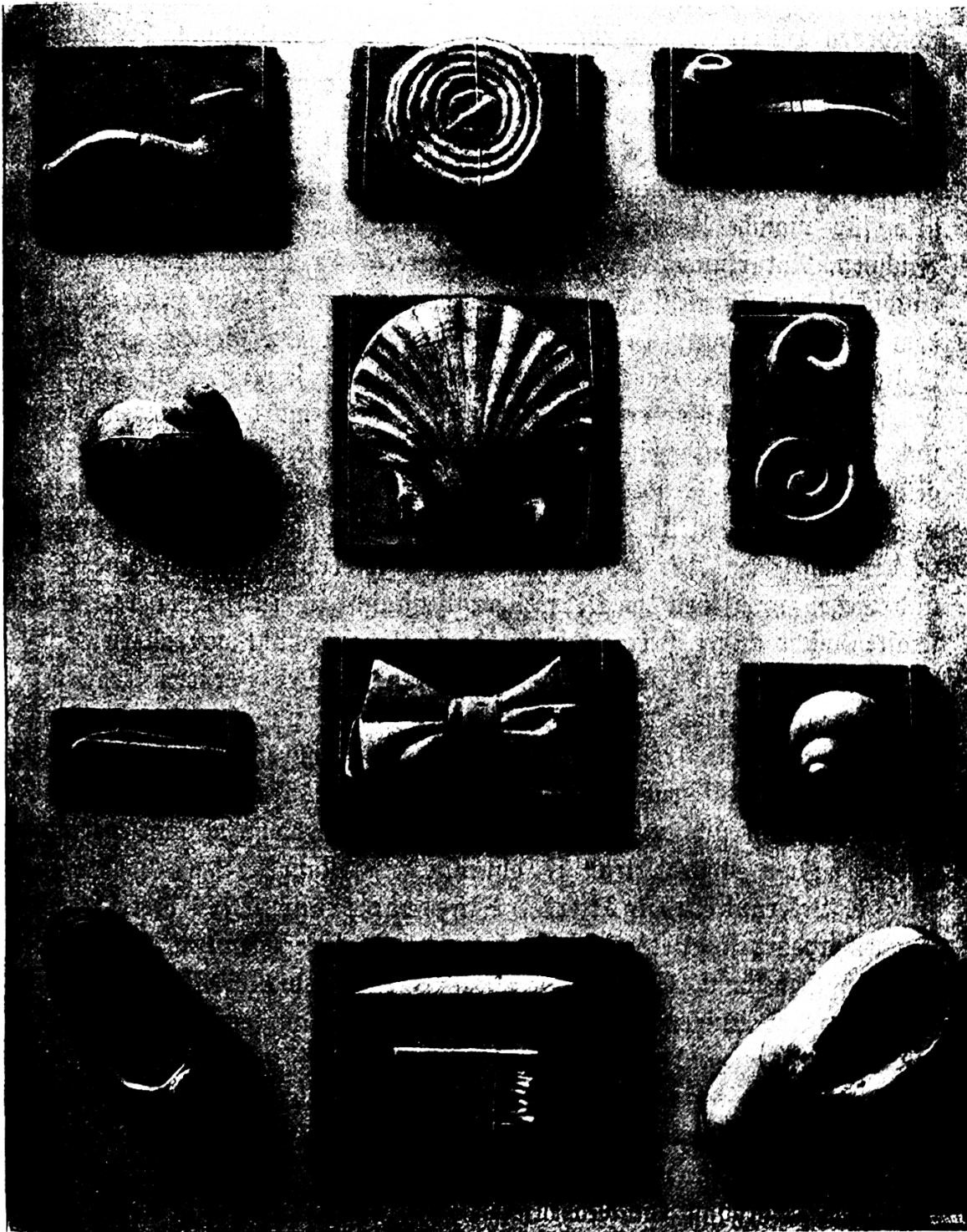
7. 1. Stufe (Knaben von 13 Jahren).

nis. Das sind kurz und gut die vorteilhaftesten Wirkungen der Handarbeit auf den Körper. Es tritt noch hinzu die Übung sämtlicher,