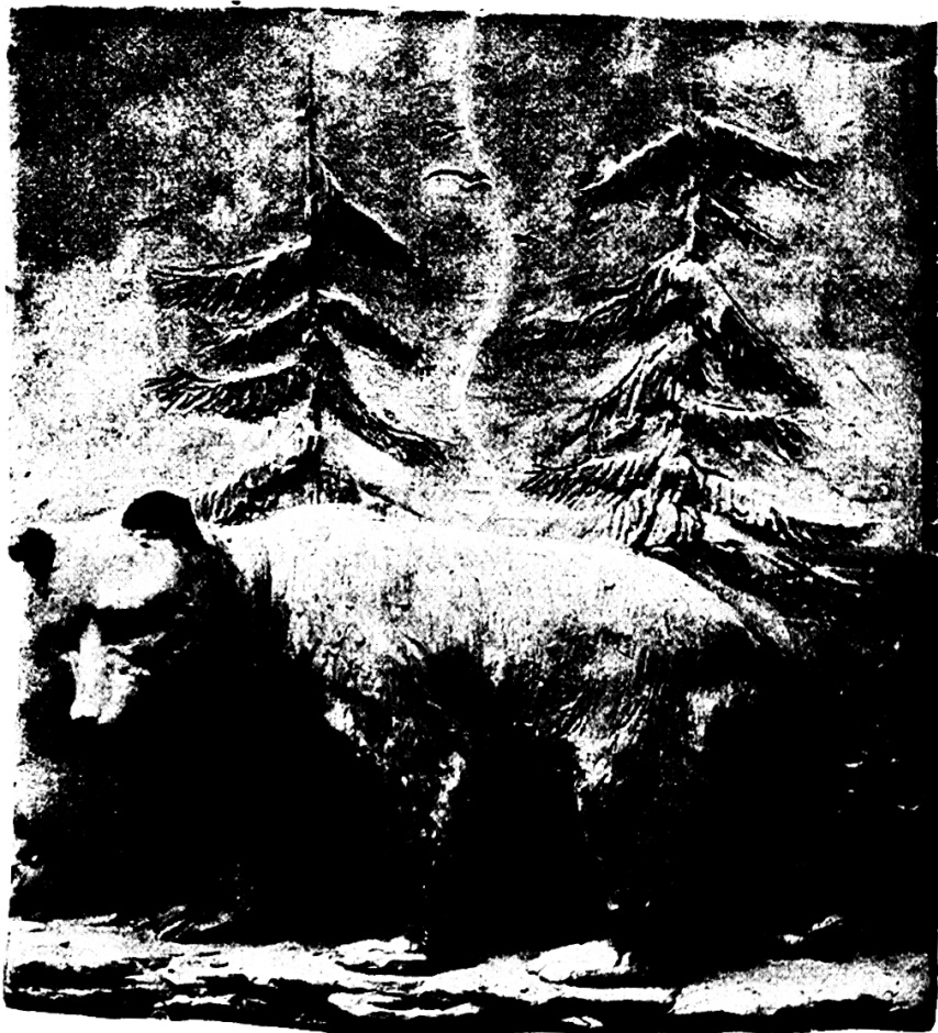
3. Stufe (Knaben von 14–15 Jahren).

für die Seminaristen die Handarbeit obligatorisch zu machen; solange sie aber nicht obligates Schulfach ist, wird dem Wunsche kaum entsprochen werden können. Einsender dies erteilt Unterricht in Knabenhandaarbeit und stets mit größerer Freude. Er begrüßt die Stunden als Abwechslung vom mehr theoretischen Schulunterricht; die Schüler zeigen das regste Interesse. Schon die Gegenstände an sich erwecken ihre Freude, noch mehr aber beglückt das Bewußtsein: „das habe ich selbst erstellt.“ Das trifft übrigens bei uns selber ebenfalls zu. Die Disziplin braucht nicht so starr und eisern zu sein. „In der Freiheit zeigt sich der Charakter.“ Ordnung soll ja sein, aber der Schüler kann sich freier bewegen; es herrscht weniger Zwang, mehr freundl. Unterweisung. Der materielle Gewinn ist für den Lehrer nicht geradezu glänzend; immerhin zahlt der Staat (Et. Gallen) pro Stunde 65 Rp.; welcher Betrag von den meisten Schulgemeinden auf Fr. 1 erhöht wird. Die Schüler zahlen für Werkzeug und Material ca. 5 bis 6 Fr., wovon dem Lehrer noch ein kleines „Bene“ bleibt. Zu erwähnen ist, daß