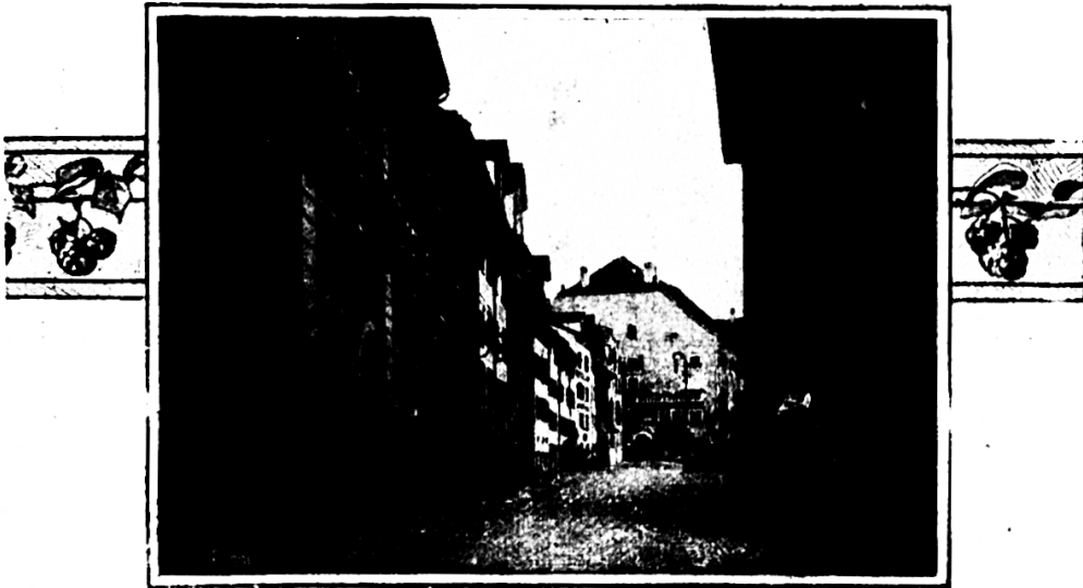
Hofplatz in Wil

Nach dem Zerfall des größeren Städtebundes blieb Wil von 1390 bis 1415 im sog. kleineren Städtebunde unter dem Schutze der Stadt Konstanz und wird in Urkunden jener Zeit als freie Reichsstadt aufge-