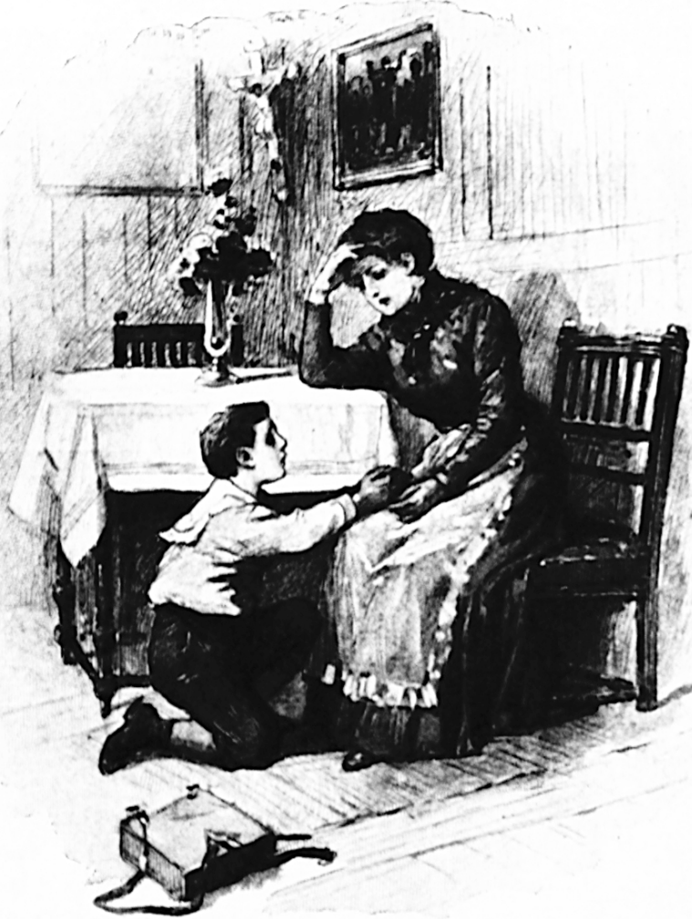
Die Träne der Mutter.

Denk- und Auffassungsweise des Kindes angepaßt und der Fassungskraft desselben entsprechend sein. Dieses Kardinal-Erfordernis eines Schulbuches kann man aber beim bloßen Lesen noch nicht gründlich genug werten, sein Vorhandensein oder der Mangel desselben zeigt sich erst recht einschneidend bei der Behandlung der einzelnen Stücke mit den Kindern. Denn erst das Kind zeigt dem Lehrer so recht deutlich, ob das Lehrmittel wirklich der Stufe angemessen ist, für die es berechnet ist. Es hängt