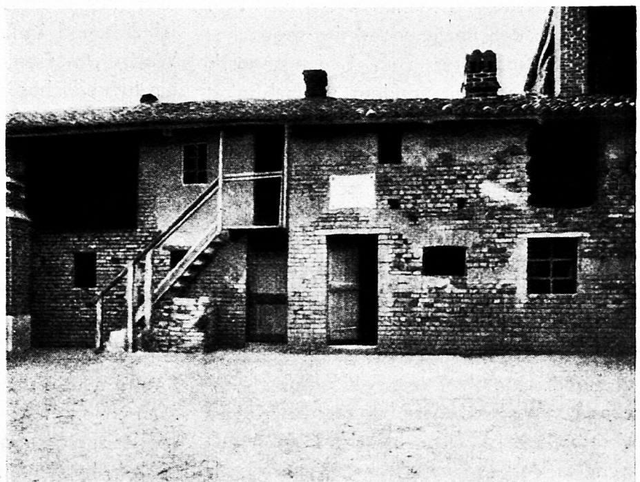
Das Geburtshaus Giovanni Boscos

fröhliches Gemüt und die Tiefe seiner Demut und Sanftmut geschützt hätten. Das alles meisselte am jungen Bosco. „Das Schicksal setzt den Hobel an . . .“ Das Schicksal? Nein, in allem sah Don Bosco klar die Vorsehung Gottes. Auf diese vertraute er in jeder Lebenslage und die Vorsehung wachte über ihm — wie uns das in erschütternden Beispielen aufgeschrieben ist —, wachte über ihn persönlich und über sein priesterliches Werk an der Jugendfürsorge. In Traumbildern sah er übrigens die stufenweise Entwicklung des Oratoriums klar voraus. Wie sollte er da vorzeitig bei scheinbaren Misserfolgen die Flinte ins Korn werfen. Ist somit Bosco nicht ein herrliches Vorbild priesterlicher Ganzheit, die im seelsorglichen Bemühen sich durch nichts von der Beharrlichkeit abbringen lässt! Und noch ein anderer Punkt aus der Taktik Don Boscos liegt der Seelsorge heutiger Zeit und heutiger Verhältnisse nahe. Der Selige suchte die verlorenen Schäflein auf. Er begnügte sich nicht mit der Predigt und der Wertschätzung der guten Presse, sondern leistete die mühselige Arbeit des „Von Mann zu Mann“. So gelang es ihm, viel hundert Seelen zu retten, die ganz der Botmässigkeit des Schmut-