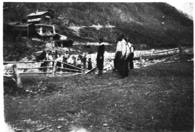
Übungen am Stemmbalken.