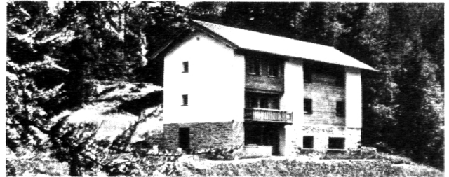
Ferienheim «Ramoschin» 7531 Tschier im Münstertal

Rund 20 Ferienheime an verschiedenen Orten.