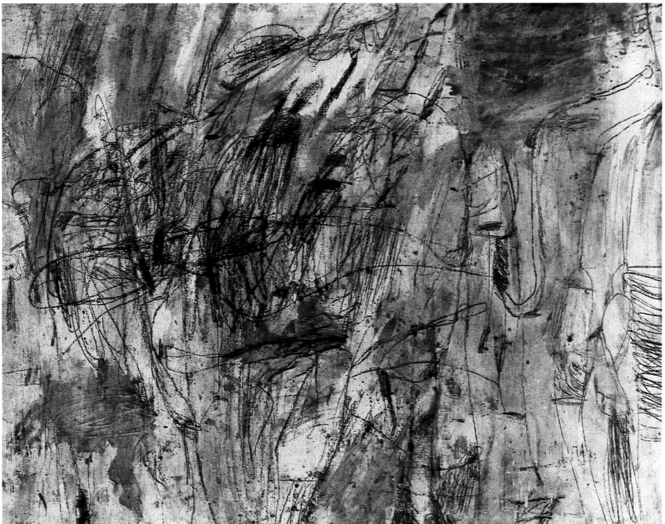
Abb. 3: Cy Twombly, «Untitled», 1954, (New York City), Kat. No. 2, Öl, Kreide und Bleistift auf Leinwand, 174,5 × 218,5 cm.

grossen Formaten, «Schulwandtafeln», die Räume mit den weissen Objekten.