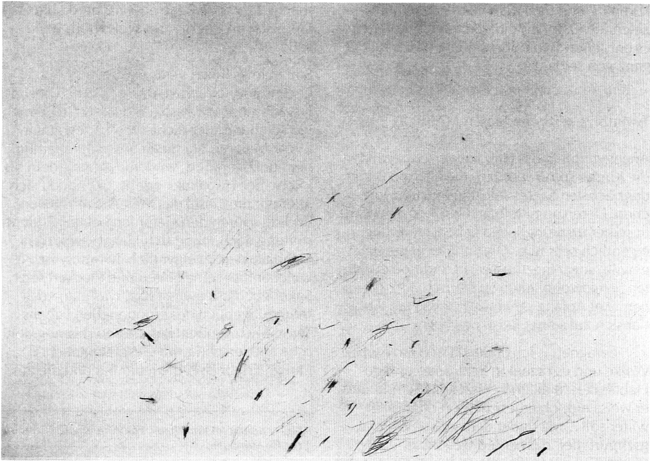
Abb. 2: Cy Twombly, «Untitled», 1958 (Roma), Kat. No. 58, Kreide und Bleistift auf Papier, 70 × 100 cm.

Erfahrung, Erinnerung kommen, auf und verschwinden wieder in der Fülle der Assoziationen. Diese Assoziationen werden bestimmt durch die Gebärden im Bildfeld. Jedes dieser Bilder ist ein offenes Kunstwerk in dem Sinne, dass es beinahe unendliche Lesarten zulässt und den Betrachter einlädt, das Bild in sich selbst neu entstehen zu lassen (nach Umberto Eco, Das offene Kunstwerk). Die Sprache der Kinder blüht ungemein auf bei solcher Betrachtung.