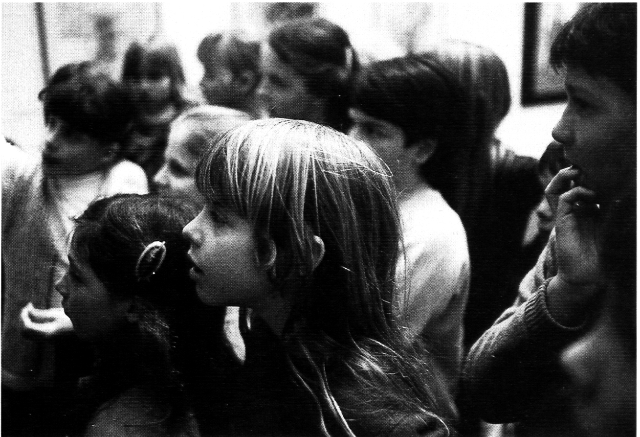
Abb. 1: Kinder im Kunsthau.

Soll man es ihnen verargen, wenn sie so gegenständlich sehen, da sich ja auch bei uns Erwachsenen die Assoziationen beim Betrachten solcher Bilder nicht ausschalten lassen? Diese Malerei, noch nah am action painting der Fünfzigerjahre, wird von den Kindern als «Reise des Habakuk» erlebt. Es handelt sich aber um die Geste des Malers beim Malen, und sie spüren den Gefühlen bei der Bildentstehung nach, ohne sich klar zu sein, dass «Habakuk» jetzt eigentlich Twombly ist, welcher hier seine Linien und Flecken setzt. Sie erleben unbewusst das, was man «das intime Tagebuch des emotionalen Lebens Twomblys» genannt hat, dessen seismographische Niederschrift. Im Gespräch tauchen Dinge, Erlebnisse, die jeder hat und die aus