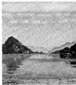
Der Himmel i der Glungge