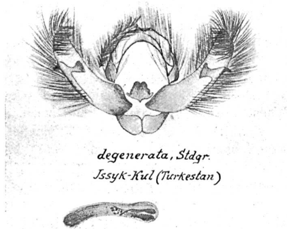
♂ Genitalapparat. Unten Penis. Vergrößerung 6 fach.

liegt. Die angegebene Größe von 32 mm beweist nichts, meine Stücke messen 35—38 mm, wie denn c-nigrum in der Größe außerordentlich variiert. Mein größtes Exemplar aus Japan mißt 45 mm, mein kleinstes (degenerata aus Issyk-Kul) 29 mm.