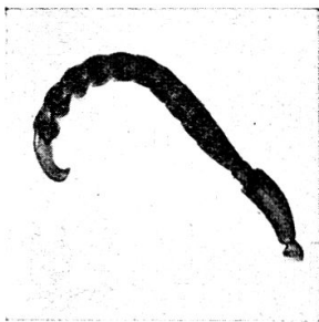
Fig. 2. Icaria shestakowi nov. spec. Fühler ♂

Ic. shestakowi unterscheidet sich, wie gesagt, von grandidieri