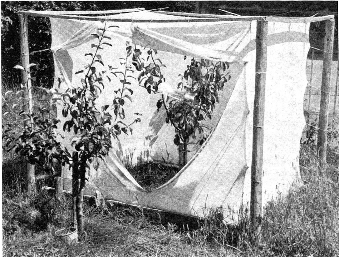
Abb. 1. — Aufnahme des Versuchsbaums mit geöffnetem Tüllzelt. Am Baum ist der in Versuch 3 und 4 verwendete Glaszylinder mit Lageräpfeln sichtbar.

worden waren. Die Überwinterung erfolgte im Insektarium; ein Teil der Raupen wurde im Frühjahr in den Thermostat zu 4° gelegt und nach Bedarf im Laboratorium zum Schlüpfen gebracht. Auf diese Weise verfügten wir von Anfang Juni bis Ende August laufend über genügend frischgeschlüpfte Falter. Bei Versuchsbeginn wurden zehn Apfelwicklerpärchen in das Zelt eingesetzt und die Art ihrer Eiablage beobachtet. Beim Absinken der Eizahlen wurden neue Falter zugegeben.