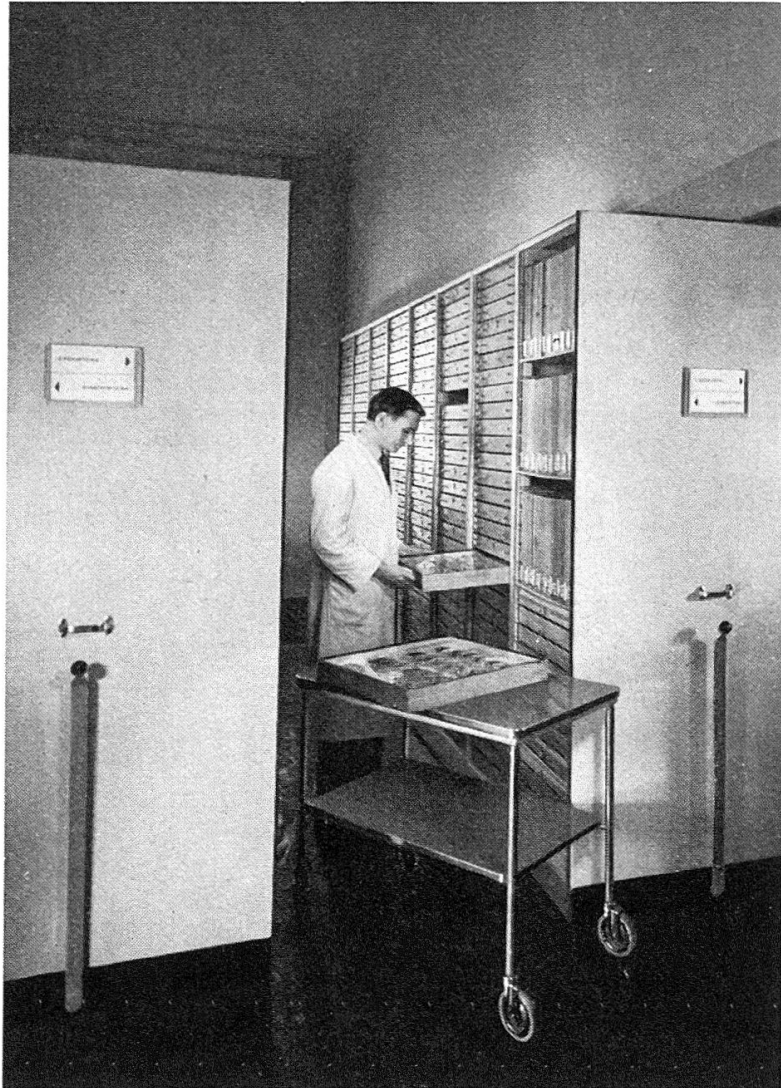
Fig. 2. — Vue d'un couloir entièrement ouvert.

Dans l'état actuel de notre musée, l'adoption de ce système a permis de gagner trois places de travail dans un local où les collections