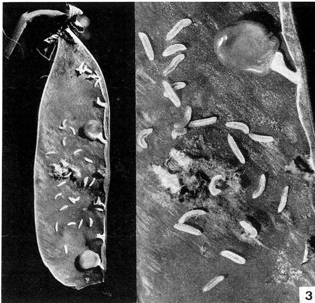
Fig. 3. — Larves à maturité dans une gousse infestée artificiellement. A gauche : grossis. 1,6×. A droite : détail, grossis. 6×.

A 20°C., il faut en moyenne 10 jours pour obtenir à partir des infestations d'œufs des larves mûres, alors qu'à 28°C. il suffit de 6 à 7 jours pour arriver au même résultat.