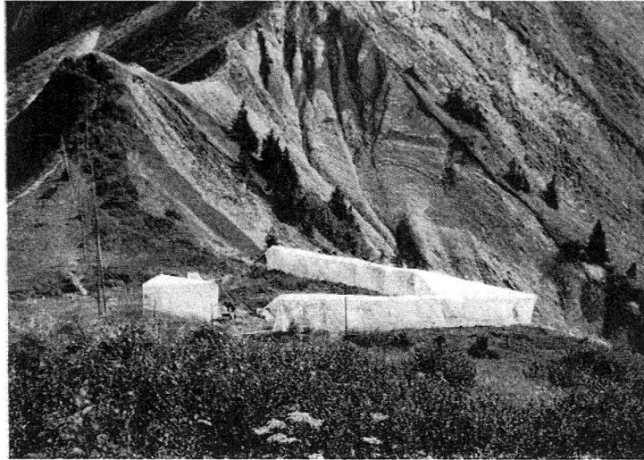
Fig. 1. — Filet de 8 m. d'ouverture, flanqué de deux rideaux de 10 m. On voit, derrière le filet, celui de 4 m. destiné au comptage horaire. (Photo prise en 1964, lors du premier essai Bretolet-Golèze.)

rideaux de térylène de 10 m. de long sur 2 m. de haut, ce qui porte le front de capture à une largeur de 18 m. (fig. 1).