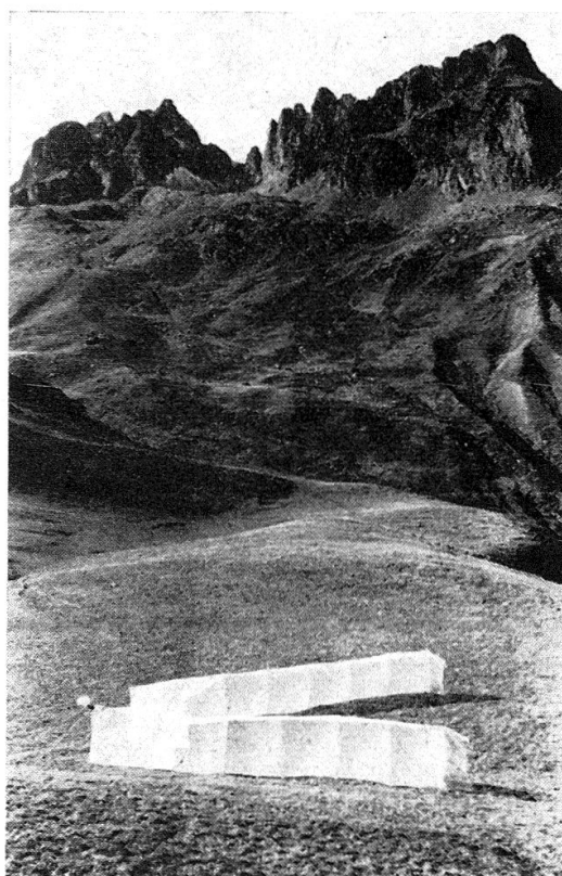
Fig. 4. — Col du Glandon, Savoie. Une des installations destinée à la reprise des Syrphides. La seconde installation est située environ 200 m. plus loin, cachée par repli de terrain.

Les pièges du type Changins étaient placés en ligne sur 100 mètres, sur le versant nord du col, à 30 mètres de la crête.