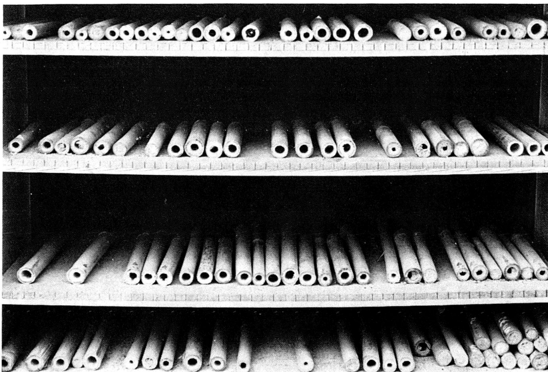
Abb. 1 Versuchsanordnung mit vier Lagen Bambusröhrchen für die Verschiebungsexperimente.

Unter Nahorientierung verstehen wir Verhaltensweisen, die durch Reize bestimmt werden, die vom Ziel selbst ausgehen (v. FRISCH 1965). Dieses Ziel ist in unserem Falle eines der etwa 20 cm langen Bambusröhrchen, die in einer 55 cm breiten und 40 cm hohen Kiste am Boden und auf drei verstellbaren Tablaren verteilt sind (Abb. 1).