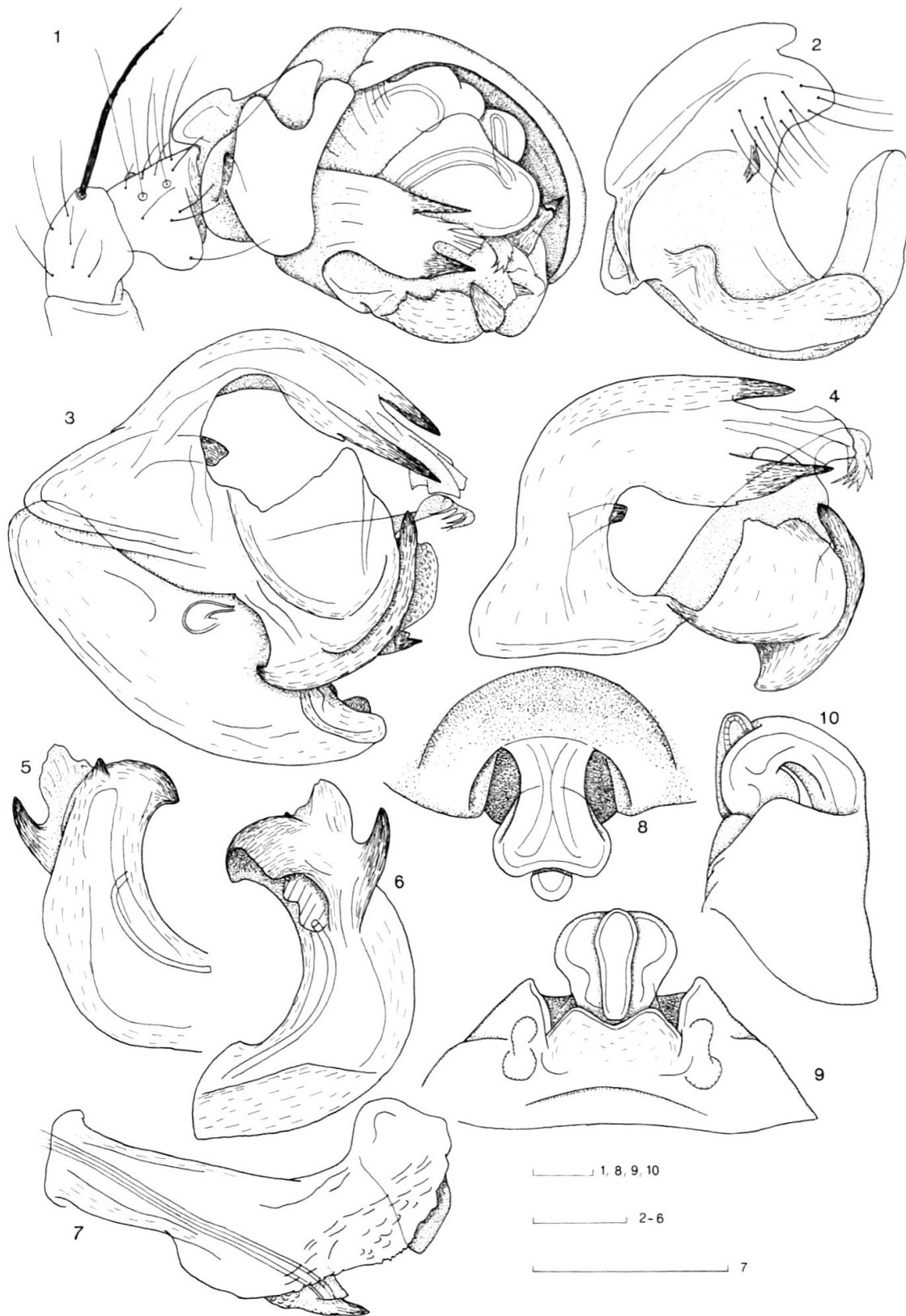
Fig. 1-10: Leptyphantes sobrius (THORELL). 1 ♂-Palpus von retrolateral. 2 Paracymbium. 3 Endapparat von ventral/retrolateral. 4 Lamella und Terminal Apophysis von retrolateral. 5, 6 M. Apophysis. 7 Embolus von retrolateral. 8, 9, 10 Epigyne von ventral, aboral und lateral. Masstäbe: 0.10 mm.