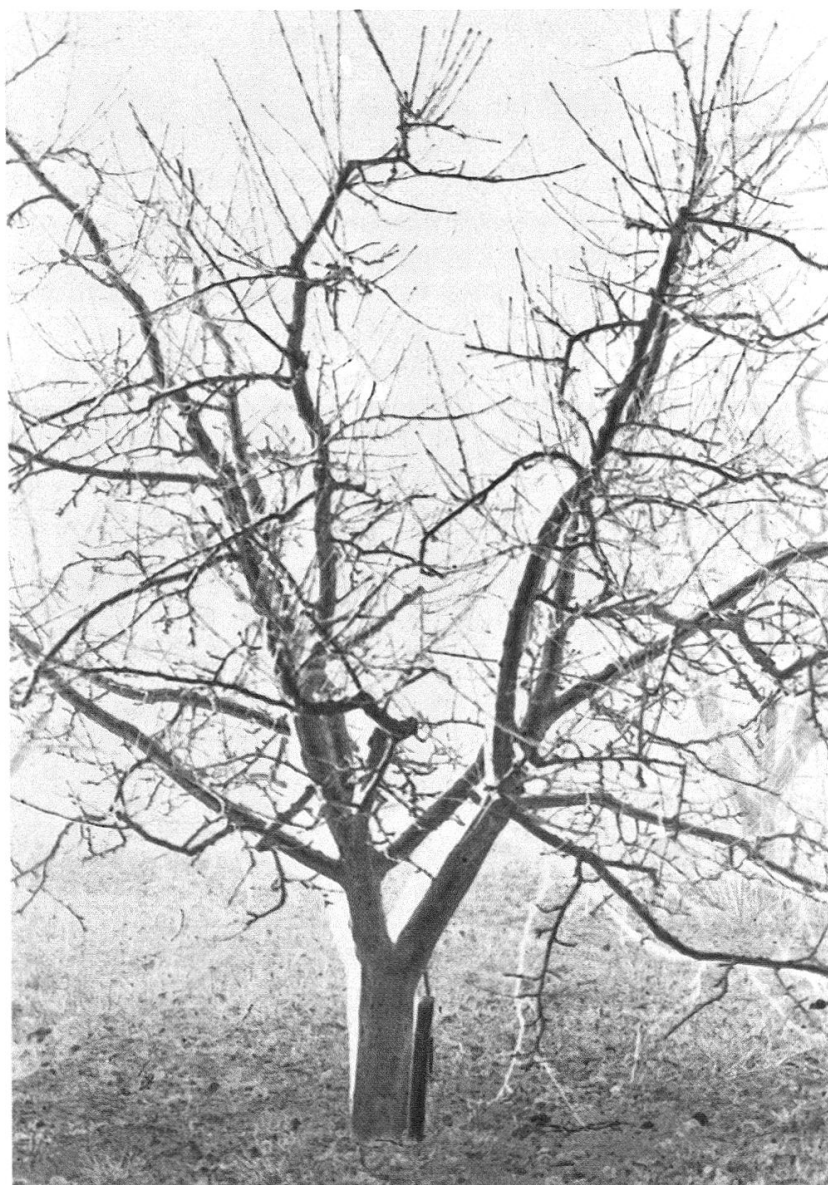
Fig. 2: Pommier Golden Delicious de 13 ans taillé en gobelet.

A Charrat, les abricotiers sont âgés de 15 à 25 ans. L'écorce est très rugueuse jusque dans les plus petites branches. Le sol est travaillé mécaniquement jusqu'au pied des arbres.