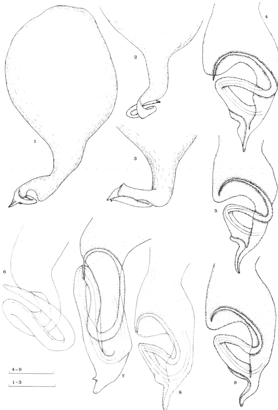
Fig. 1-9: Harpactocrates drassoides : 1 Bulbus (Bonfol), 4-5, 8-9 Bulbus-Ende (4 Viozene, 5 Cuneo V. Grande, 8 Bonfol, 9 Miroglio). H. apennicola : 2 Bulbus-Hals und Embolus, 6 Bulbus-Ende (Vallombrosa). H. intermedius : 3 Bulbus-Hals und Embolus, 7 Bulbus-Ende (Viozene). Massstäbe: 1-3 = 0,5, 4-9 = 0,2 mm. Zeichnungen: I. MADLENER.