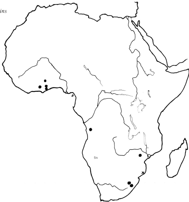
Fig. 11: Répartition de Eucinetus africains (●, Eucinetus elongatus ; x, Eucinetus enavanis ).

les angles postérieurs presque droits. Scutellum triangulaire, aussi long que large.