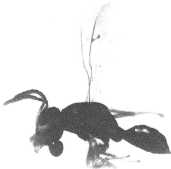
Fig. 1. ♂ Halticoptera imphalensis sp. n.