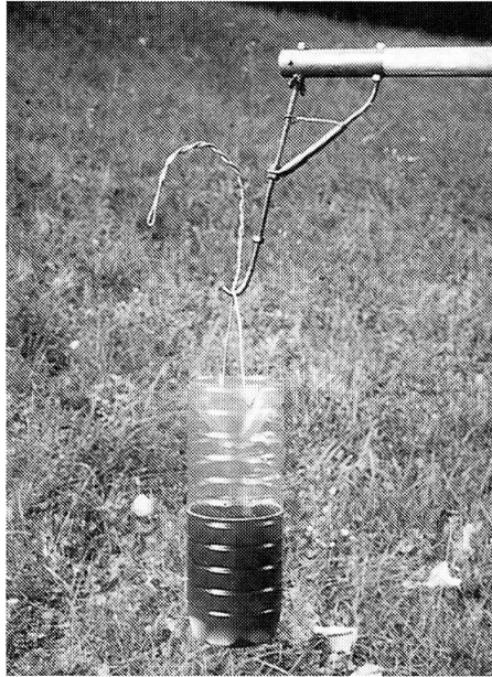
Fig. 2. Piège prêt à être placé.

La composition de l'appât est fonction de la durée du piégeage et de l'objectif poursuivi. De nombreuses recettes performantes ont été proposées pour le piégeage sur les troncs ou dans les cavités (SIMON, 1954; BERGER in LESEIGNEUR, 1972; nombreuses communications personnelles). SIMON a pu ainsi comparer le pouvoir attractif de différents fruits et de la bière sur les Coléoptères dans différents sites. Certains composés chimiques comme la térébenthine, des alcools, des esters ou des acides organiques peuvent être attractifs pour certains groupes d'insectes notamment parmi les Coléoptères (DILLON & DILLON, 1972; DONALDSON et al. , 1986; ALM et al. , 1986).