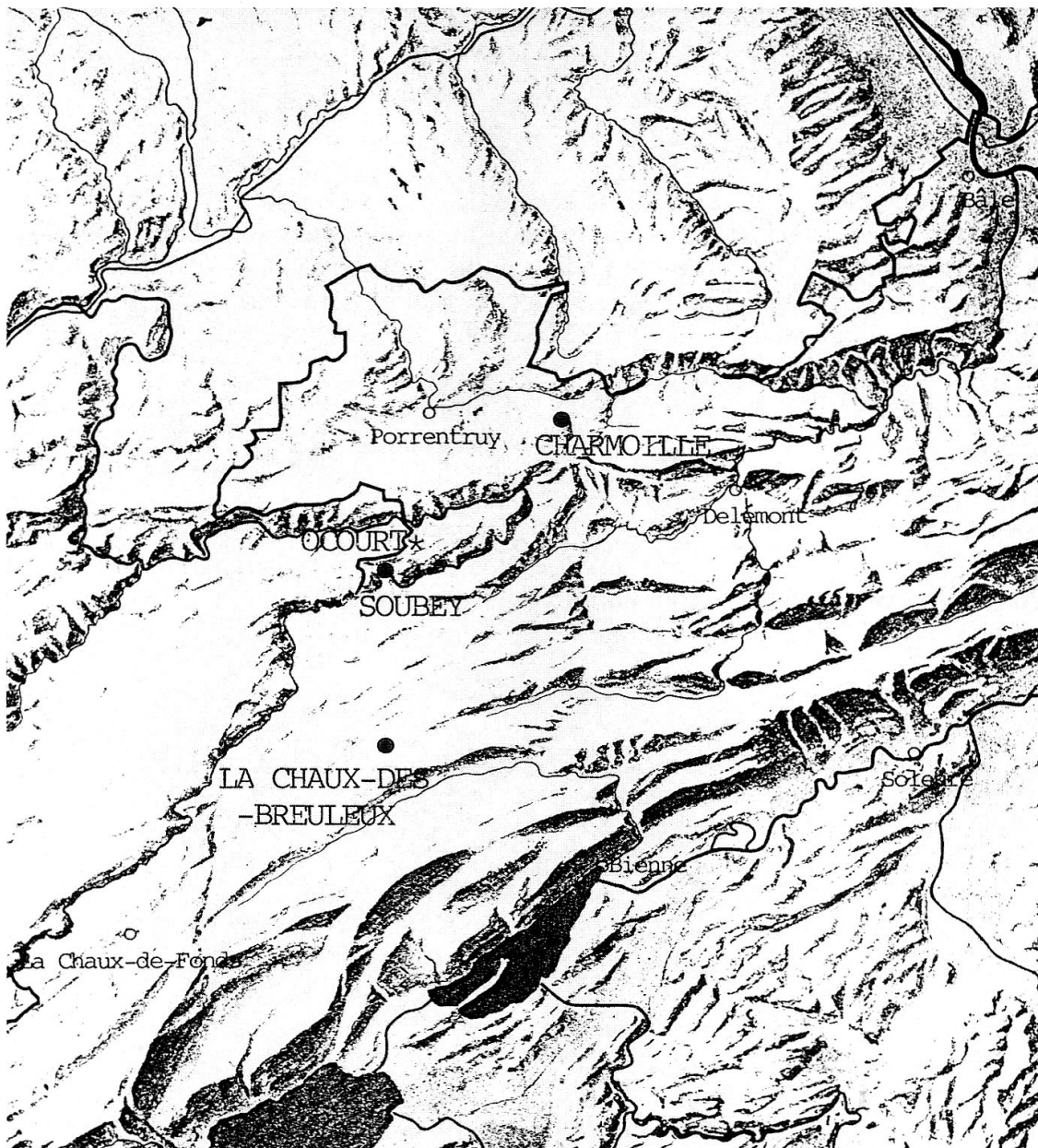
Fig. 2: Situation géographique des stations de St. stigmaticus (●) et Ch. vagans (★). Reproduit avec l'autorisation de l'Office de topographie du 24.2.1995.