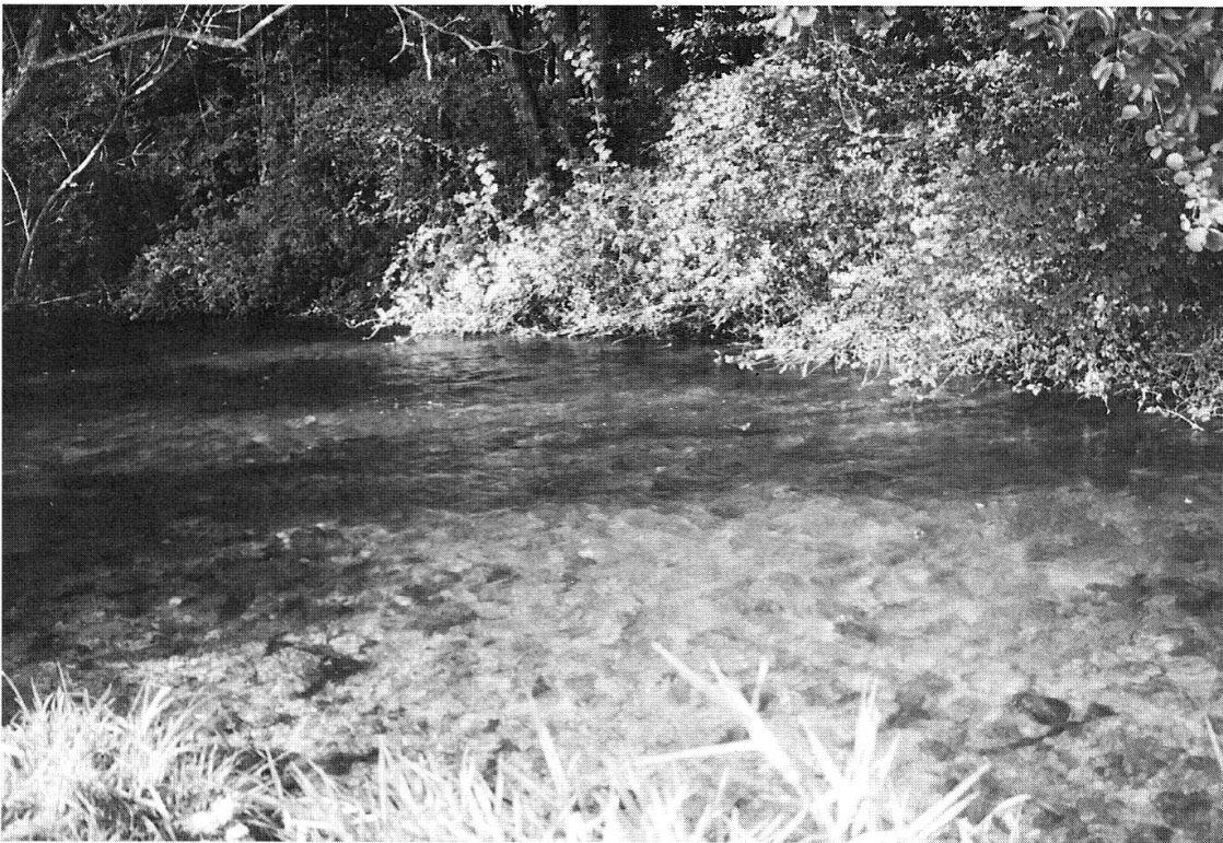
Fig. 2. Vue de l'Hallwiler Aabach, en aval de l'Hallwilersee

Le Doubs est une rivière importante (fig.1) d'environ 25 mètres de large, et dont le débit en étiage est encore supérieur à 20 \text{ m}^3/\text{s} . A St-Ursanne cette rivière présente un faciès à dominante lenticule caractéristique de l'épipotamal. L'Hallwiler Aabach au contraire est un exutoire de lac mesurant environ 7 mètres de large, dont le débit est inférieur à 1 \text{ m}^3/\text{s} , et présentant un faciès caractéristique du métarhithral (fig. 2).