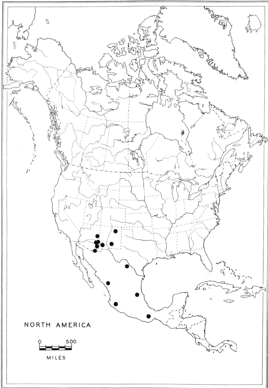
Fig. 6: Distribution de Nycteus falsus .