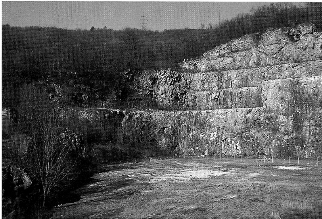
Fig. 4 – Station 3, Arzo. Carrière de calcaire abandonnée. Les individus d' Acrotylus patruelis se trouvaient sur les parties dénudées.

Dans le Tab. 1, nous avons également indiqué les espèces présentes dans les milieux en contact avec les stations à A. patruelis . Ces listes ne sont certainement pas exhaustives, mais l'effort de chasse est comparable entre les trois stations. Plusieurs espèces témoignent du caractère très pionniers des habitats fréquentés par A. patruelis : Eumodicogryllus bordigalensis , Pteronemobius lineolatus , Aiolopus strepens , Sphingonotus caeruleans et Oedipoda caeruleans .