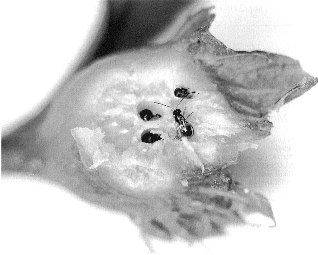
Abb. 1. Puppen und ein ausflugbereites Weibchen von Dryocosmus kuriphilus in einer aufgebrochenen Galle.