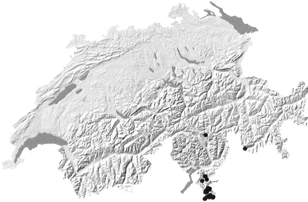
Abb. 6. Verbreitung der Edelkastaniengallwespe Dryocosmus kuriphilus in der Schweiz, Stand Herbst 2009. (Schwarze Punkte: Fundorte von Dryocosmus kuriphilus )

Torymus sinensis zwar nach wie vor vorhanden; die Befallsintensität an den japanischen Kastanien Castanea crenata sowie die gallwespenbedingten Ausfälle bei der Fruchtproduktion sind aber deutlich zurückgegangen. Weniger als 5 % der Triebe werden seither neu durch die Gallwespe befallen. Diese Freisetzung gilt als Paradebeispiel einer biologischen Bekämpfung mit einem eingeführten, natürlichen Feind.