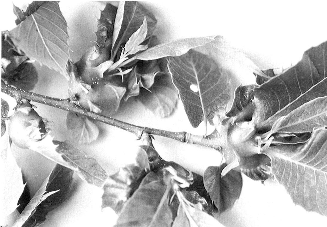
Abb. 3. Die auffälligen Gallen an einem Kastanienzweig.

wintern in den Knospen. Zu diesem Zeitpunkt sind an den Knospen äusserlich noch keine Symptome sichtbar. Während des Austriebs im Folgejahr werden die Larven aktiv und stimulieren das Pflanzengewebe zur Gallenbildung (Abb. 2 und 3). An befallenen jungen Trieben, Blütenständen und Blättern bilden sich 0,5 bis 2,5 cm grosse, glattwandige, mehrkammerige Gallen (Abb. 3). Sie sind hellgrün bis rosa verfärbt. Nach wenigen Wochen Frass im Innern der Galle erfolgt dort die Verpuppung (dunkelbraune Puppe). Meist schaffen dies ungefähr drei bis sechs Larven pro Galle (Abb. 2 und 4). Die neue Wespengeneration fliegt noch im gleichen Sommer im Juni oder anfangs Juli aus. Im Kanton Tessin wurde der früheste Ausflug am 3. Juni 2009 festgestellt. Männchen können nicht beobachtet werden. Dryocosmus kuriphilus scheint sich nur parthenogenetisch zu vermehren (Zhi-yong 2009).