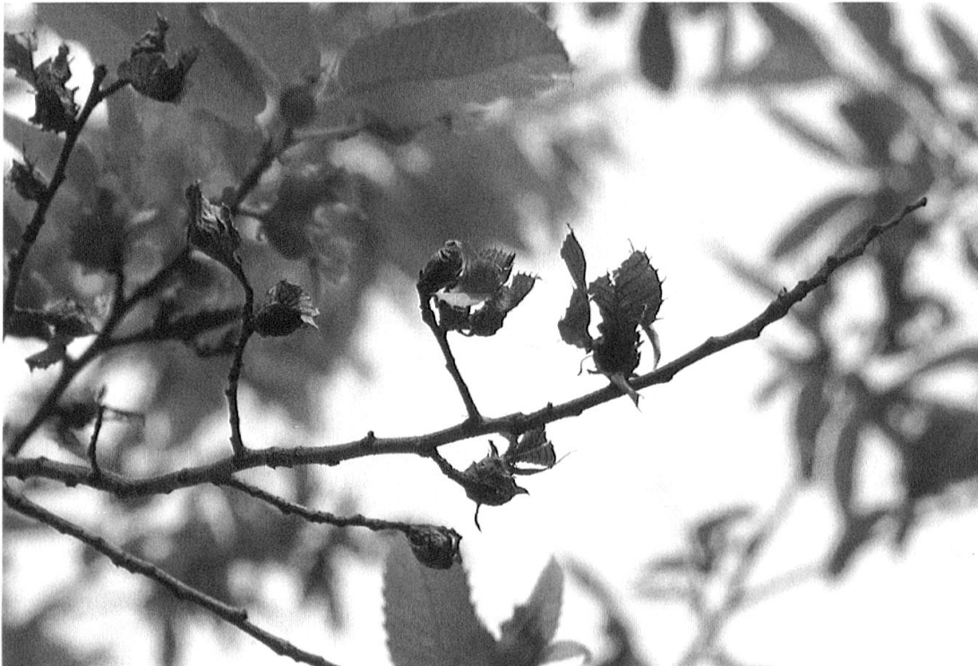
Abb. 5. Verlassene Gallen trocknen sehr rasch ein. Bei einem starken Befall kann auch der Kastanienzweig absterben.