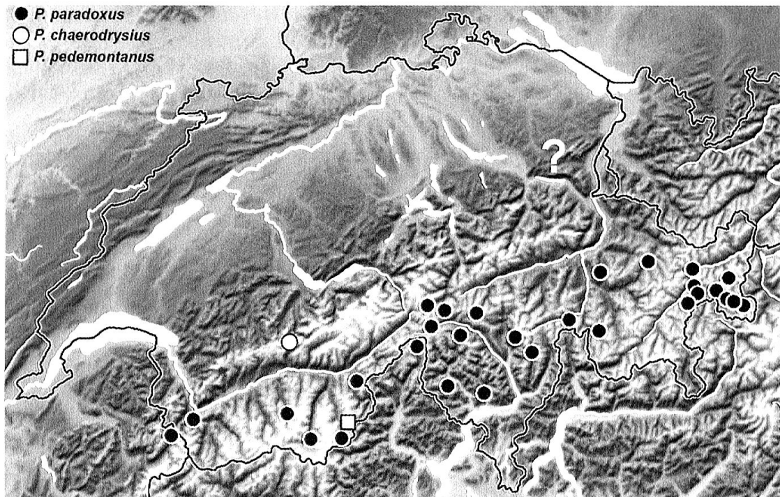
Abb. 2. Fundpunkt-Karte aller drei in der Schweiz vorkommenden Polydrusus ( Piezocnemus )-Arten basierend auf Literatur- und Sammlungsdaten.

Ein sehr ähnlich disjunktes Verbreitungsmuster wie P. chaerodrysius – mit Populationen in den Karpaten, den Ostalpen und den Zentral- und Westalpen mit lokalen Populationen bis in die Schweiz – zeigen auch Vertreter der Gomphocerinae (Orthoptera) wie Podismopsis Zubovskii , 1899 und Stenobothrus Fischer , 1853 (Berger et al. 2010). Dort wird davon ausgegangen, dass die isolierten Populationen Relikte einer früher weitreichenden Verbreitung sind, und dass die Tiere während der Erwärmung im Interglazial in diesen alpinen Refugien überdauerten.