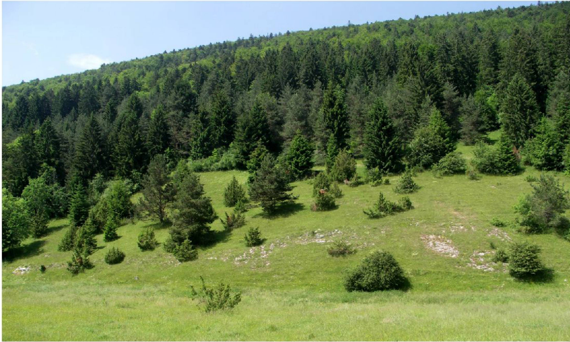
Fig. 6 : Habitat de Poecilium glabratum à Monible BE, Pâturage aux Bœufs, photo LJ.

par exemple au centre des Grisons ou dans la vallée de la Sarine du côté de Château-d'Oex, deux régions où a été signalé anciennement Lamprodila festiva .