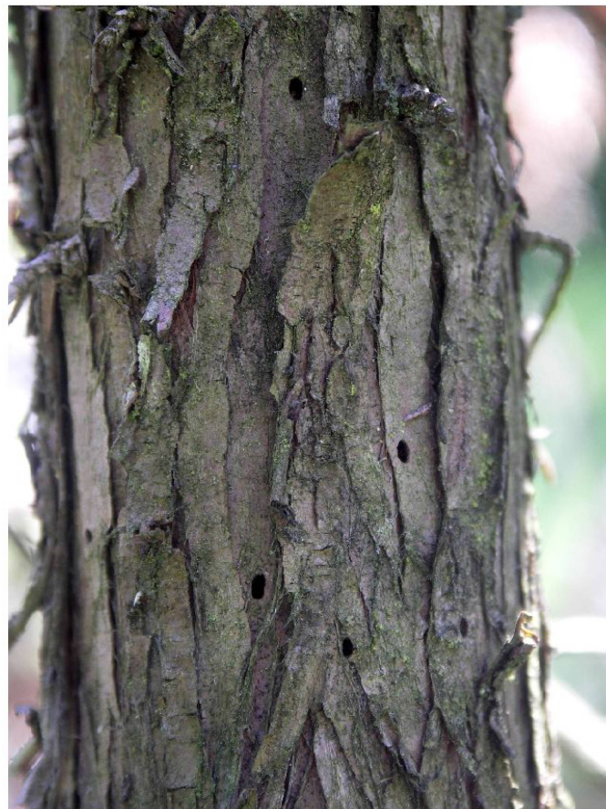
Fig. 3 : Trous de sortie de Poecilium glabratum . Monible BE, Pâturage aux Bœufs, photo LJ.