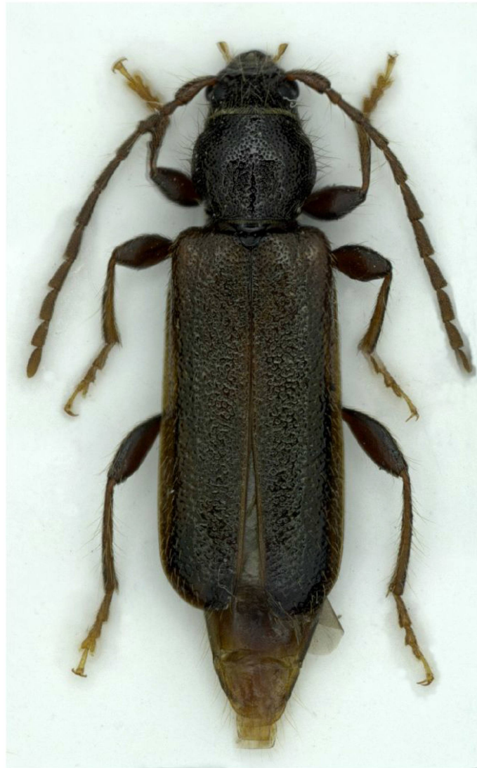
Fig. 4 : Poecilium glabratum imago. Steg-Hohtenn VS.

(dét. Christoph Germann). Entre le 9 janvier 2014 et le 26 mars 2014, douze individus supplémentaires de P. glabratum ont émergé du bois stocké à une température de 15 °C (Fig. 4), de même que cinq Anthaxia istriana et environ 20 individus d'un Ichneumonidae indéterminé (cGK). En dehors de la donnée non confirmée du Val Ferret de Rätzer (1888), il s'agit de la première mention de P. glabratum en Valais.