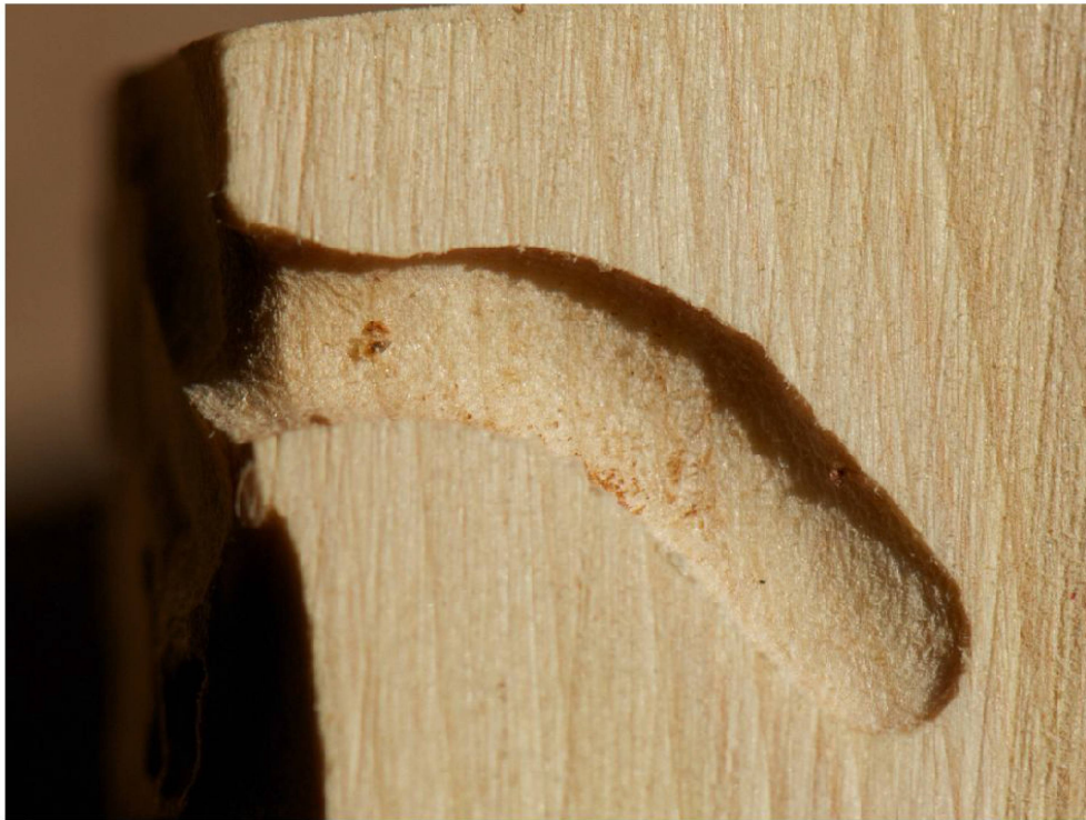
Fig. 2 : Loge nymphale de Poecilium glabratum . Corcelles BE, Côte aux Bœufs, photo SG.