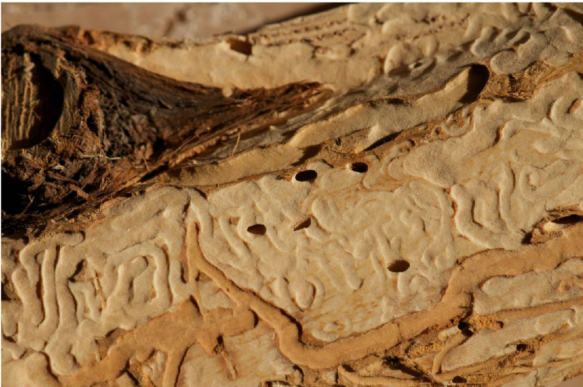
Fig. 1 : Galeries larvaires et entrée des loges nymphales de Poecilium glabratum et Phloeosinus t. thujae (en bas à droite). Corcelles BE, Côte aux Bœufs, photo SG.

En août 2005, SG découvre un buisson de Juniperus communis s.str. sec sur pied dans une pinède thermophile surplombant Corcelles (BE), au lieu-dit Côte aux Bœufs (601/238, 950 m). Il prélève le tronc et découpe une rondelle dans le but d'estimer l'âge du buisson. Le 23 février 2006, il remarque sur la rondelle un Cerambycidae. LJ le détermine à sa grande surprise comme Poecilium glabratum à l'aide de Bense (1995). Dans les jours qui suivent, deux spécimens supplémentaires émergent de la rondelle de bois, alors qu'un individu mort en loge est encore découvert