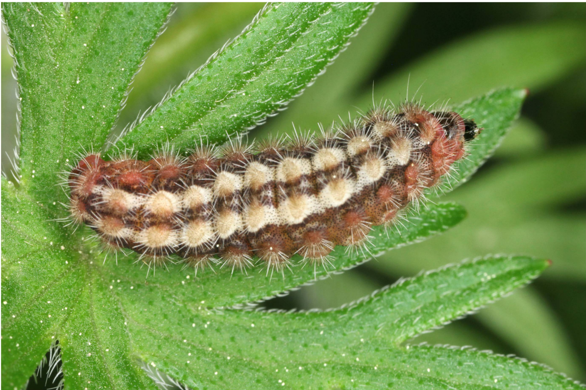
Abb. 4. Erwachsene Raupe (Dorsalseite) von A. dujardini aus dem Wallis (Zucht 2014/2015; Population Eggerberg).