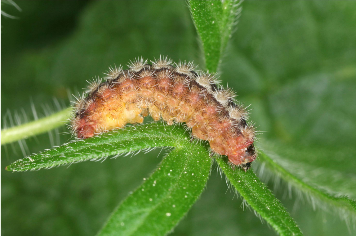
Abb. 7. Erwachsene Raupe (Lateralseite) von A. dujardini aus dem Wallis (Zucht 2014/2015; Population Eggerberg).