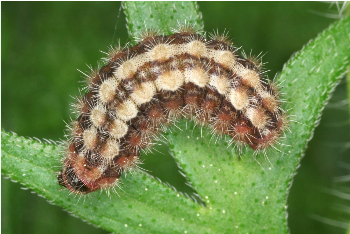
Abb. 5. Erwachsene Raupe (Dorsalseite) von A. dujardini aus dem Wallis (Zucht 2014/2015; Population Eggerberg).