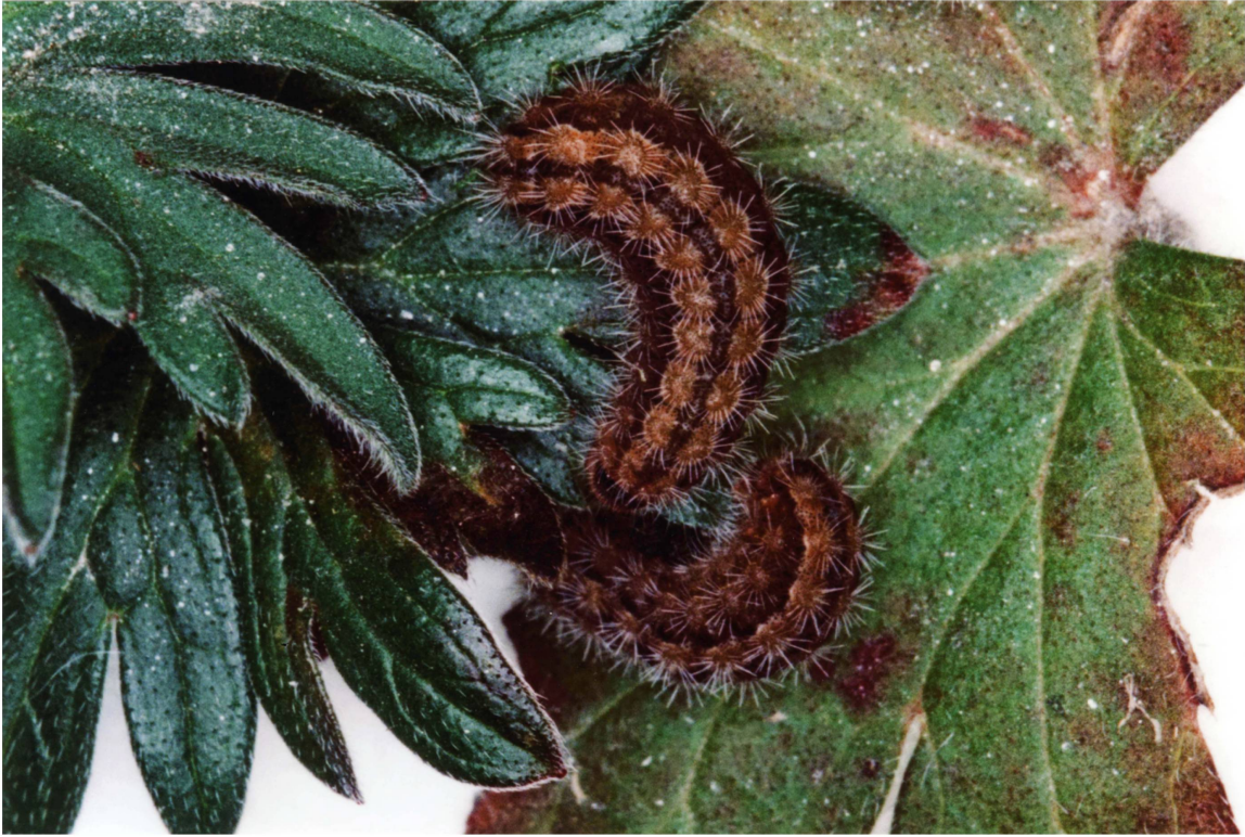
Abb. 3. Erwachsene Raupen (Dorsalseite) von A. dujardini vom Typenfundort (Zucht 2014/2015; Italien: Provinz Macerata, Monte San Vicino, Pian dell'Elmo).