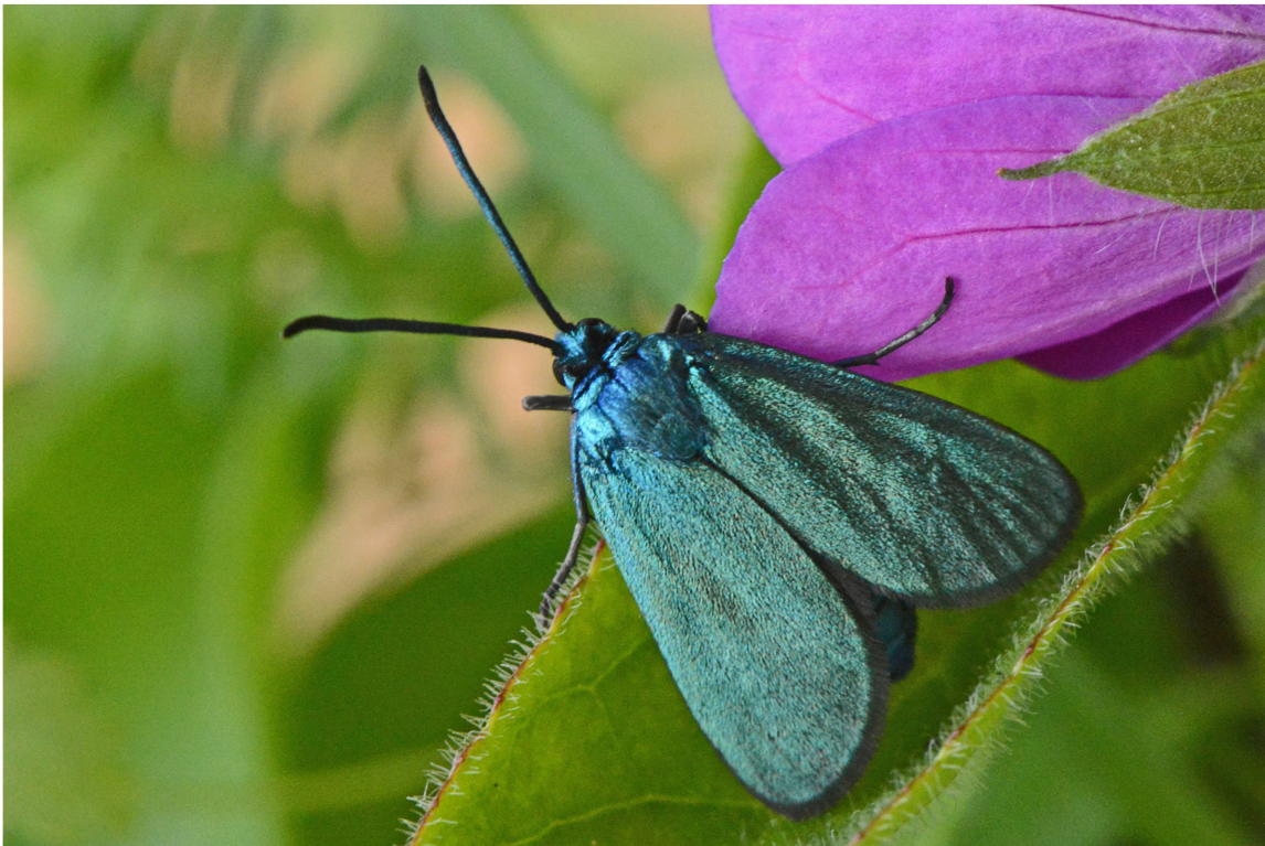
Abb. 9. Weibchen von A. dujardini (Zucht 2014/2015; Population Eggerberg).