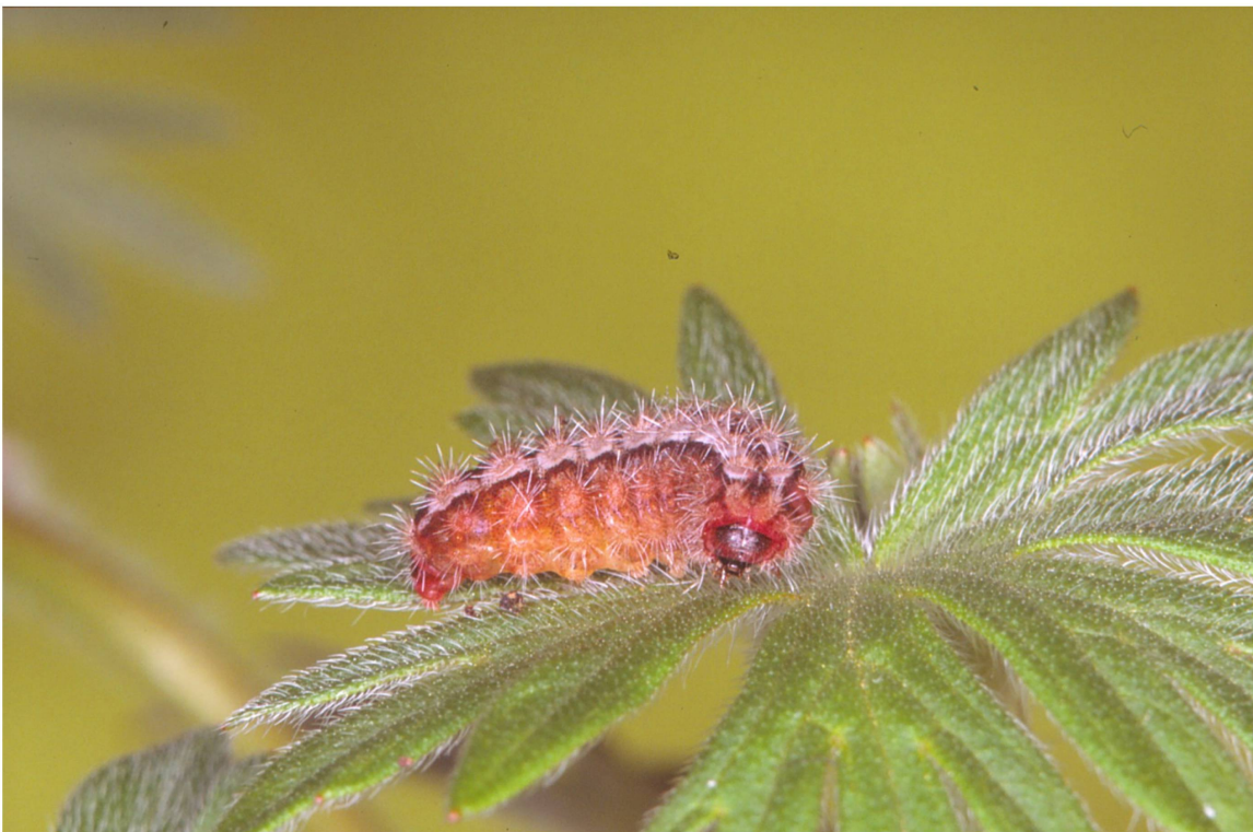
Abb. 6. Erwachsene Raupe (Lateralseite) von A. dujardini aus dem Wallis (Zucht 2014/2015; Population Eggerberg).