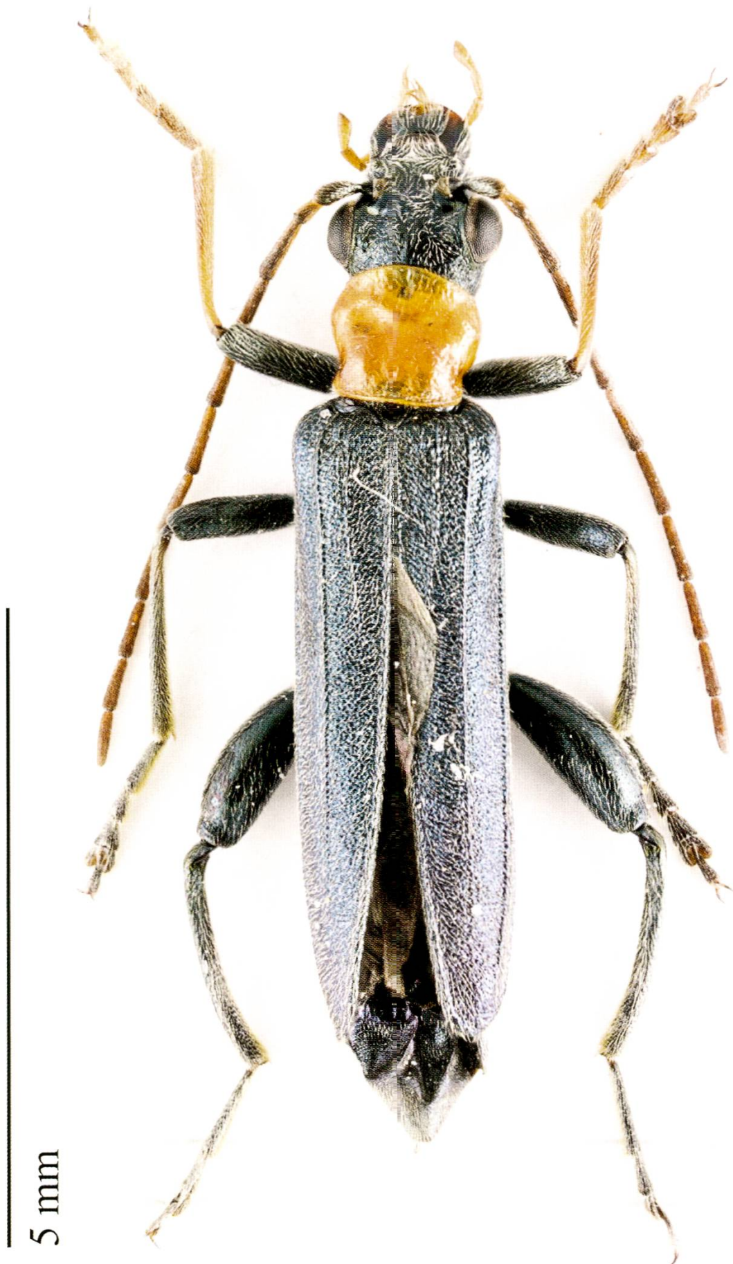
Fig. 1. Oedemera croceicollis : mâle, Helv., VD, Le Lieu, 17.VI.2015.