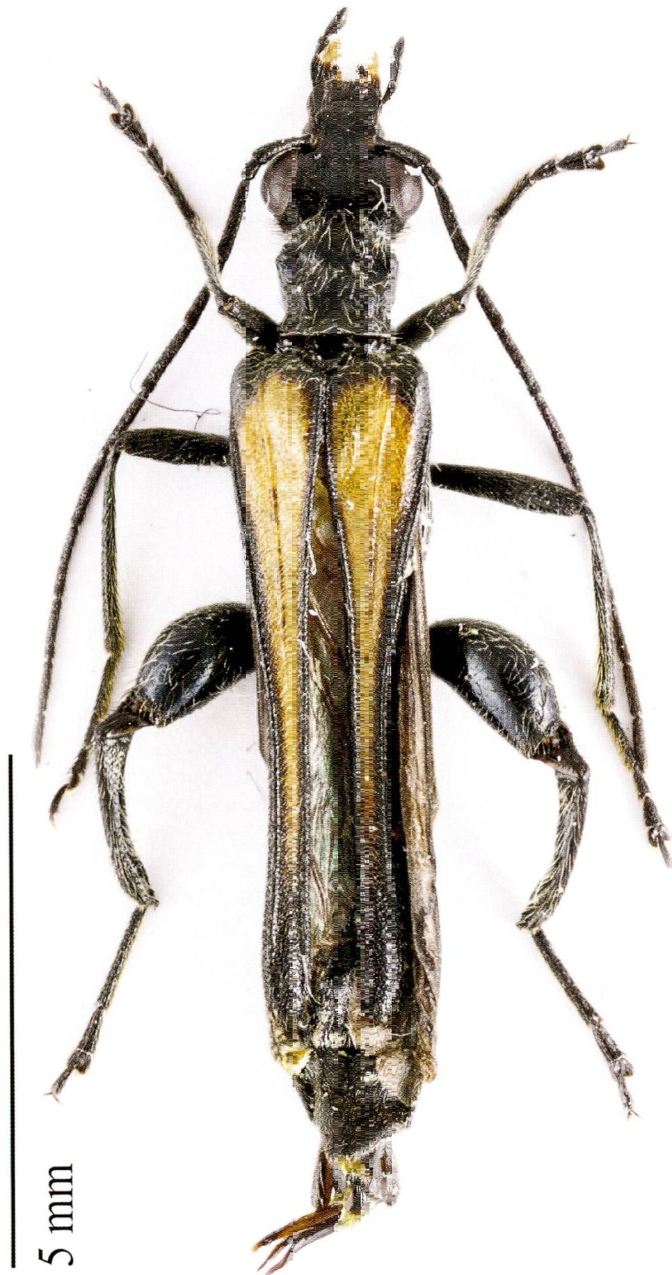
Fig. 4. Oedemera pthysica : mâle, Helv., BL, Dittingen, 13.VI.2015 (photo A. Sanchez).