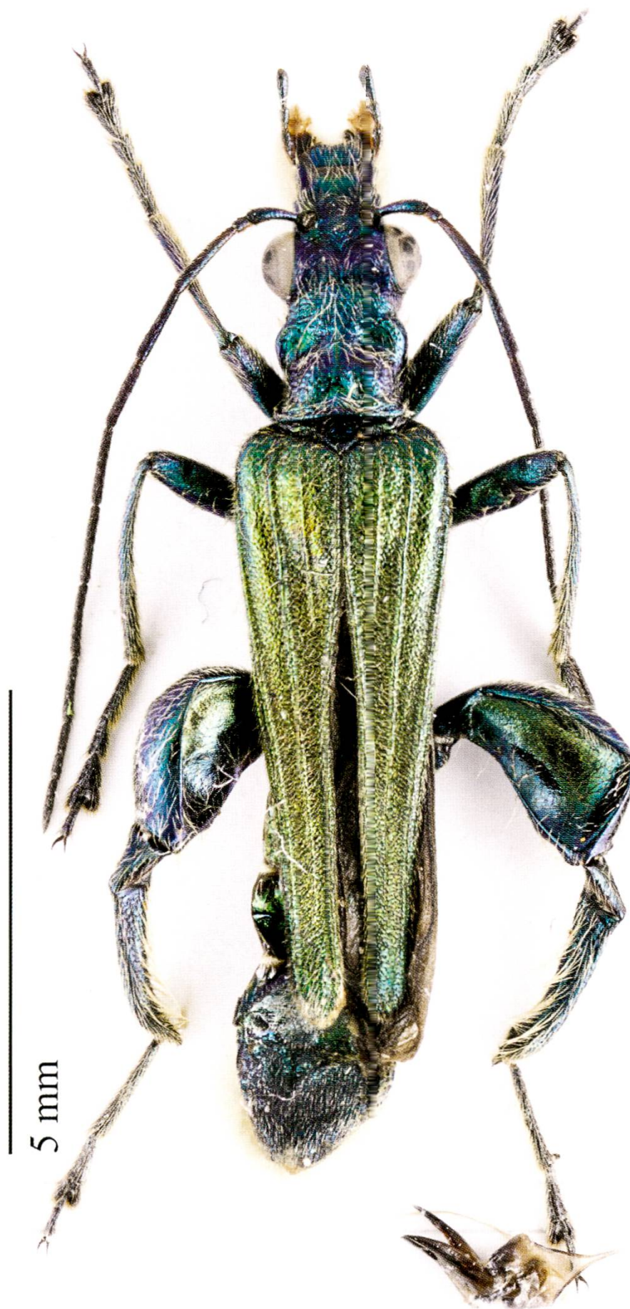
Fig. 3. Oedemera nobilis : mâle, Helv., TI, Mendrisio, 14.V.2014.