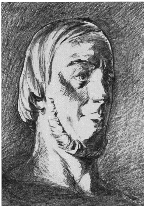
Musée des Arts et Métiers, Paris

Froment gehört zu den interessanten, vielseitigen, aber in der Schweiz trotzdem wenig bekannten Pionieren. Am 3. März 1815 wurde er in Paris geboren. Seine hervorragende Beobachtungsgabe und Vorliebe für Mechanik — er baute sich z. B. im Alter von 15 Jahren mit primitivsten Mitteln eine Uhr — veranlassten seinen aus Reims stammenden Vater, ihm das Studium an der Ecole Polytechnique in Paris zu ermöglichen.