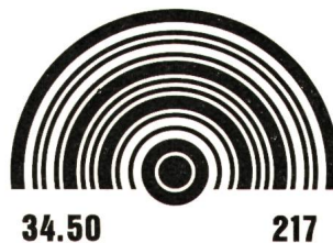
Fig. 1 Das APOSS-Codezeichen

Ist die Standfläche des Artikels, auf der das CZ angebracht wird, schief oder gekrümmt, so können nicht beliebig viele gleiche aufeinanderfolgende Bits aufgelöst werden, da, bedingt durch die Schräglage, eine scheinbare Verkürzung der Ringbreite und damit eine Reduktion der Anzahl Bits eintritt. Weitere Schwierigkeiten der Auflösung kommen dazu, z. B. die Nichtlinearität des optischen Systemes bezogen auf die Breite