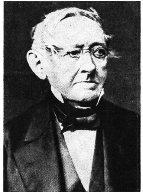
Deutsches Museum München

1826 gab Poggendorff das Verfahren der Spiegelablesung an, 15 Jahre später das Kompensationsverfahren zur Bestimmung