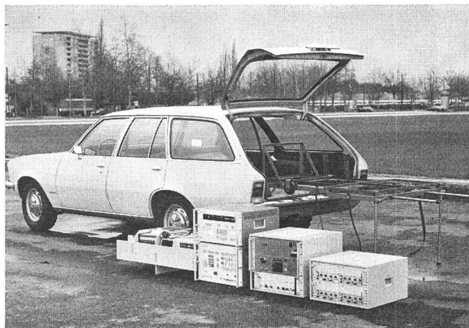
Fig. 4 Computergesteuerter Messplatz mit Transportfahrzeug

Von links nach rechts: Mikrocomputer mit Drucker und Bandgerät, SMPU Anzeige- und Steuerteil, Adaptionsgerät mit Interfaces, Speiseblock für bestimmte Funkgeräte.