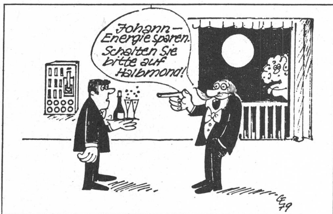
«Zeitung für kommunale Wirtschaft», München, 11. Januar 1980

Leserbrief aus «Zürichsee-Zeitung», Stäfa, 15. Januar 1980