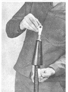
Endverschluss Typ T: schnell und einfach montie