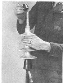
Problemlose Montage eines aufschiebbarer Freiluft-Kabelend- abschlusses