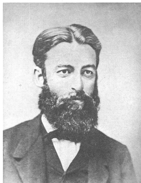
Lothar Meyer

gewichtet». 1876 folgte er abermals einem Ruf, diesmal an die Universität Tübingen, wo er 1894 Rektor wurde. 1890 erschien sein Werk «Grundzüge der theoretischen Chemie».